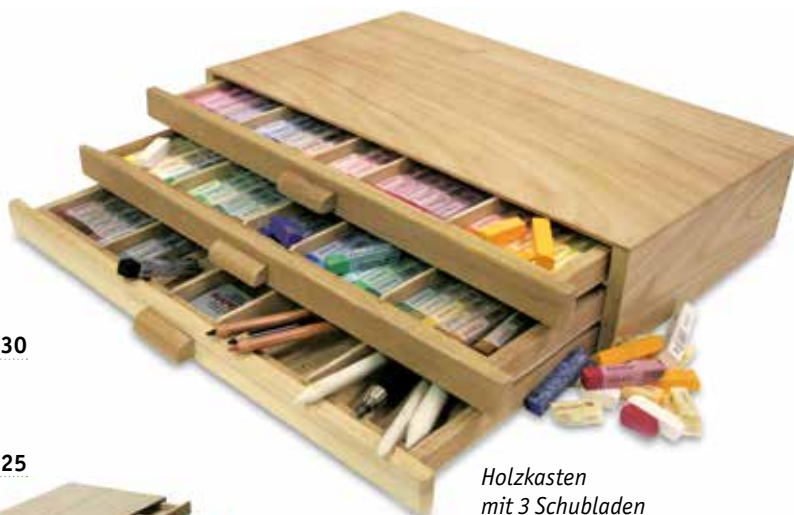
Holzkasten mit 3 Schubladen