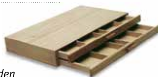
Holzkasten mit 2 Schubladen