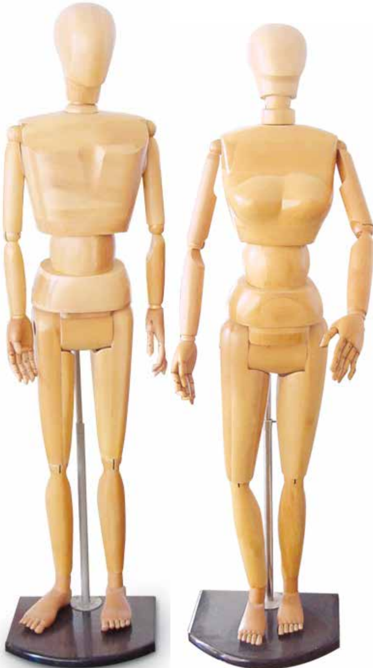
lebensgroße Modellpuppe männlich